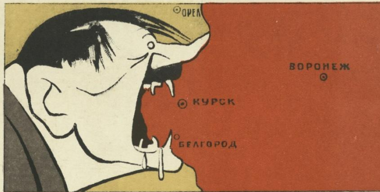
Соблазнился главбандит, Разыгрался аппетит.